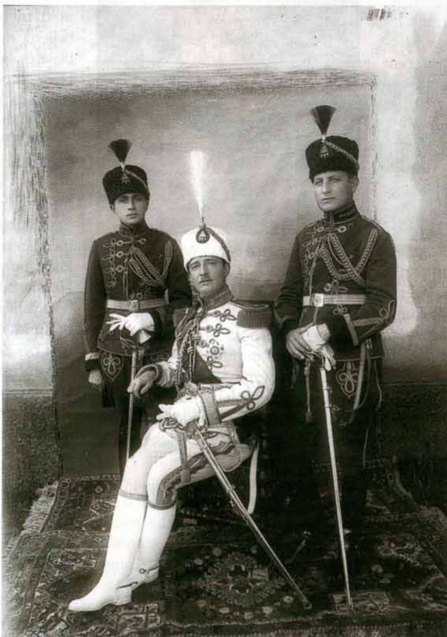
Mbreti i shqiptarëve, Zogu I

Fusha të cilën duamë ta studiojmë deri më sot ka qenë e paprekur. Ne po nisemi në këtë mision të vetëdijshëm se nuk do të mund ta paraqesim tërësisht dhe pa zbrazëti- ra eventuale gjithë këtë histori, por